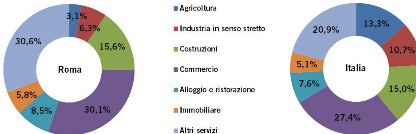
Graf. 3 – Incidenza percentuale delle imprese registrate per attività economica (ATECO2007 al netto delle imprese Non Classificate) al 31 marzo 2016