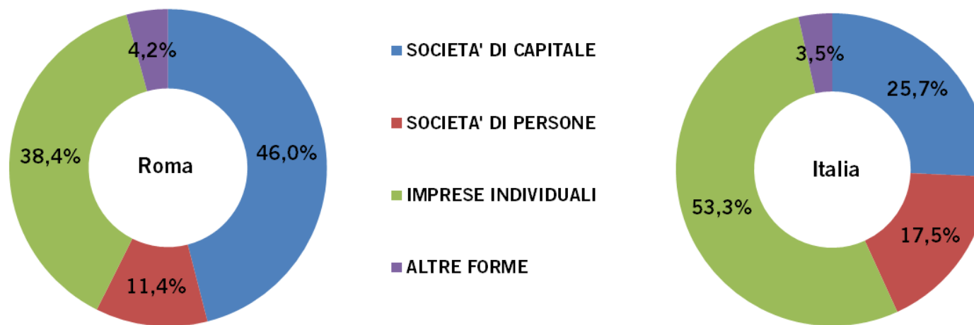
Graf. 2 – Incidenza percentuale delle imprese registrate per forma giuridica al 31 marzo 2016